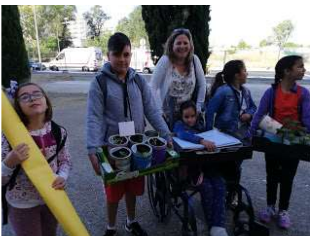
Coop. Las Lomas