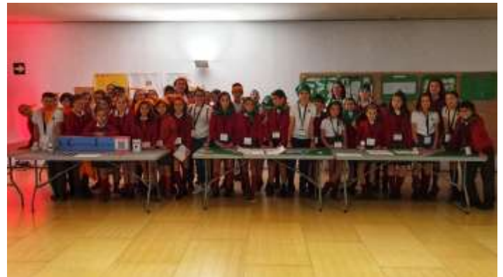
La Compañía Express