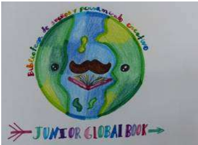
Junior Global Book