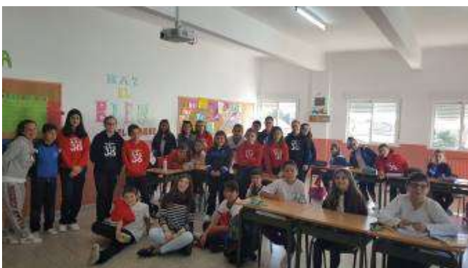
You Little Teachers