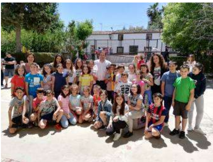
La trastienda de los Sueños

CEIP Santa Lucía, Puebla de Sancho Pérez