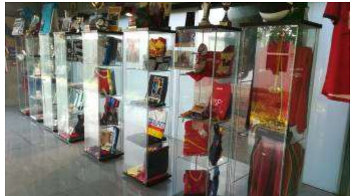
Museo Sport Cheles