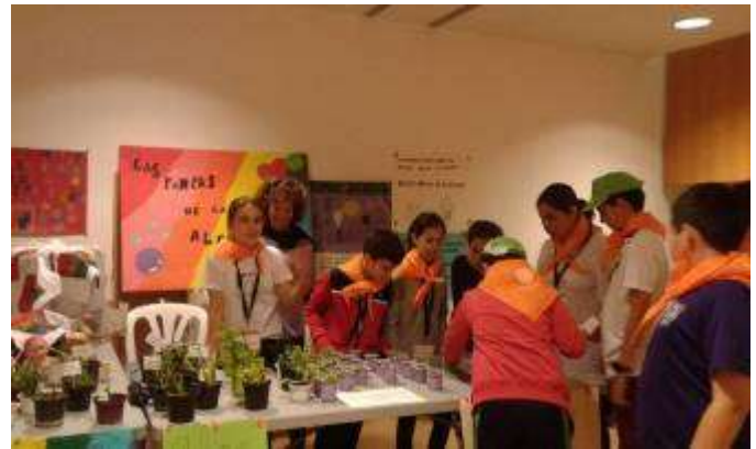
Las Pompas de la Alegría