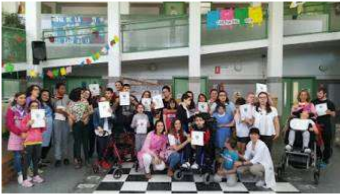
La Casa Encantada de Emprender