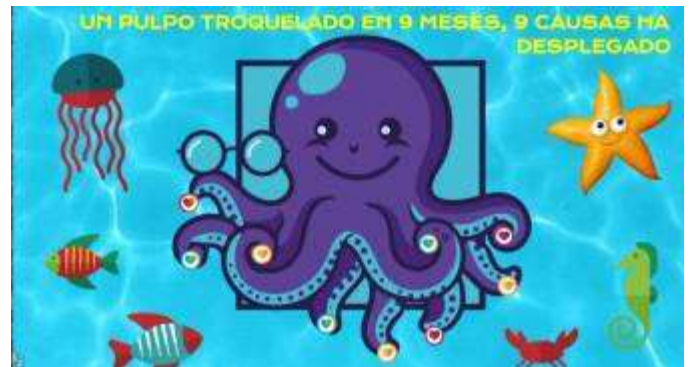
Un pulpo troquelado en 9 meses 9 causas se ha desplegado