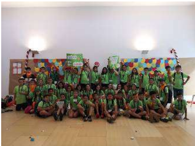
Érase una vez...y colorín colorado!