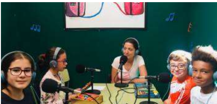
Radio Las Eras