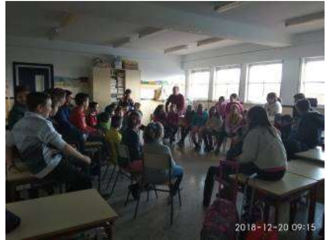
Perfumontes 10, SC