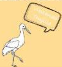
Guía de Trujillo para niños