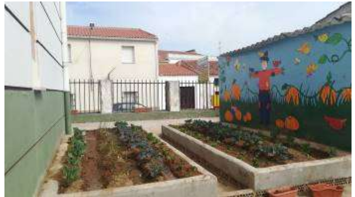
La Huerta de Lolino

CEIP Torres Naharro, Torre de Miguel Sesmero