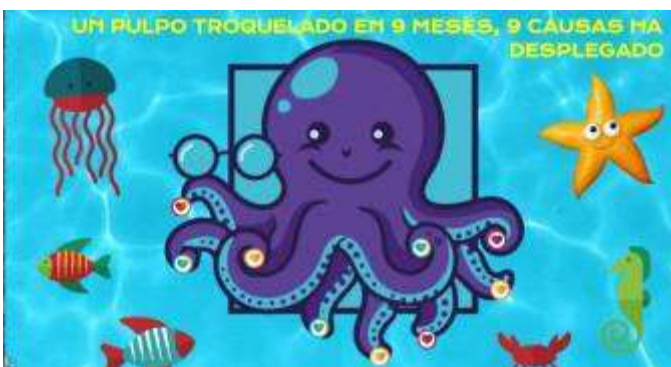
Un pulpo troquelado en 9 meses 9 causas se ha desplegado