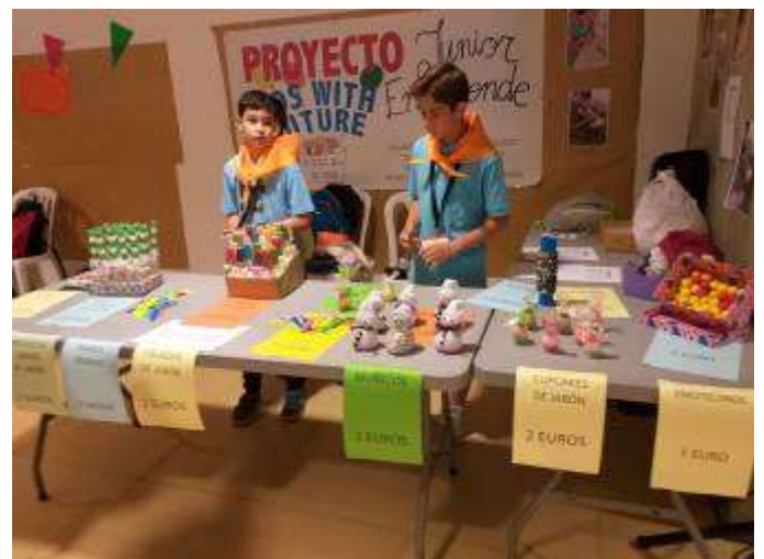
Kids With Future