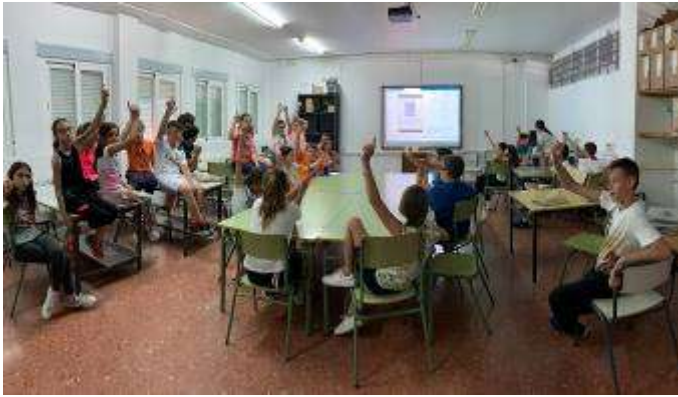
Los Colonos de Sartenejas