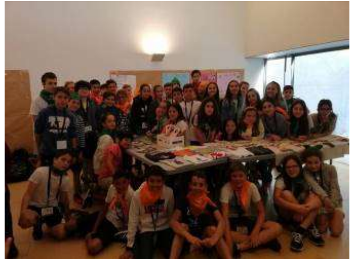
London and more...