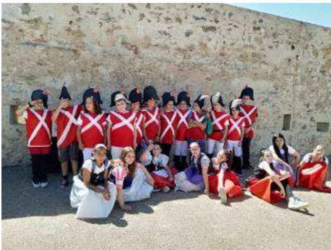
La Increíble Familia de Fátima

Proyecto artístico en colaboración con MUS-e, a través del artista visual David. Exposición fotográfica artística en el Fuerte de San Cristóbal con los mayores del barrio. El mensaje será "cuidemos a los que más saben".