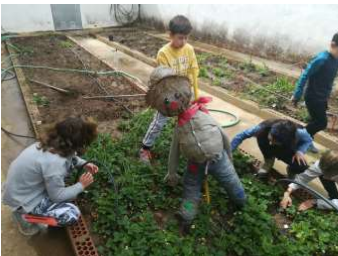
CRA entre fogones... cocinando valores