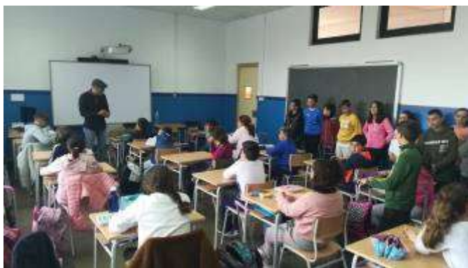
By Junior Emprefrex