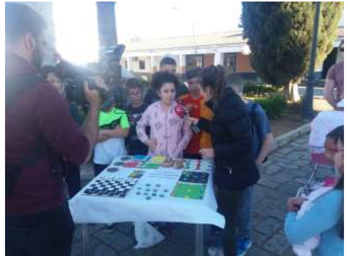
Utilizamos recursos naturales