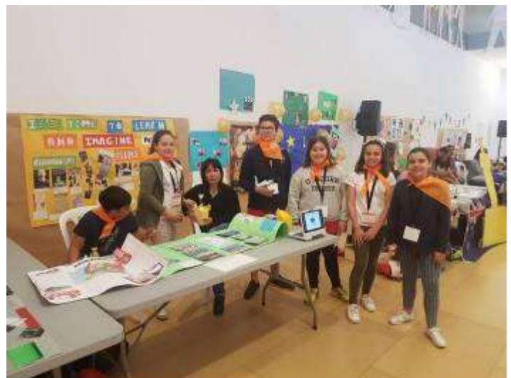
It's Time to Learn and Imagine