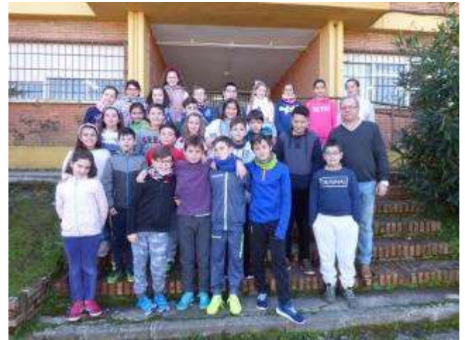
¿Y si exponemos?