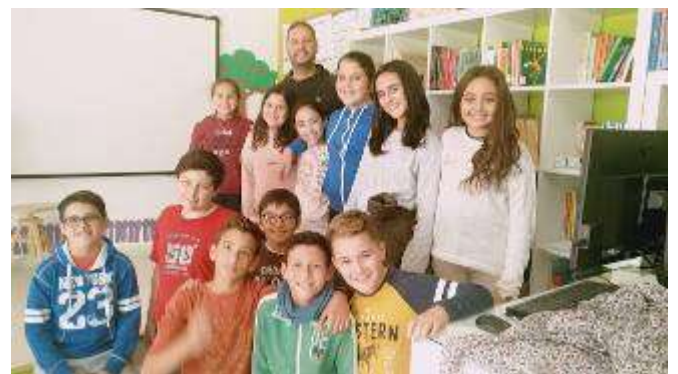
Productora Audiovisual Ecológica