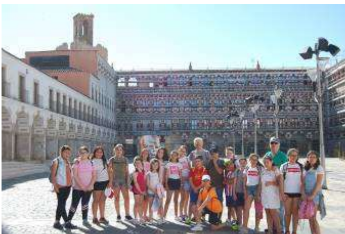
Badajoz, una tierra por descubrir